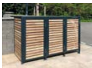
Kompaktné boxy pre odpadové nádoby