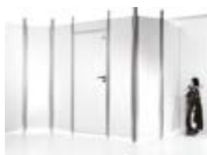
Systémy pivničných kobiek