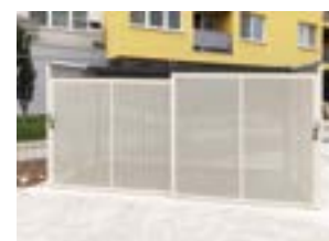
Posuvné boxy pre 2 kontajnery