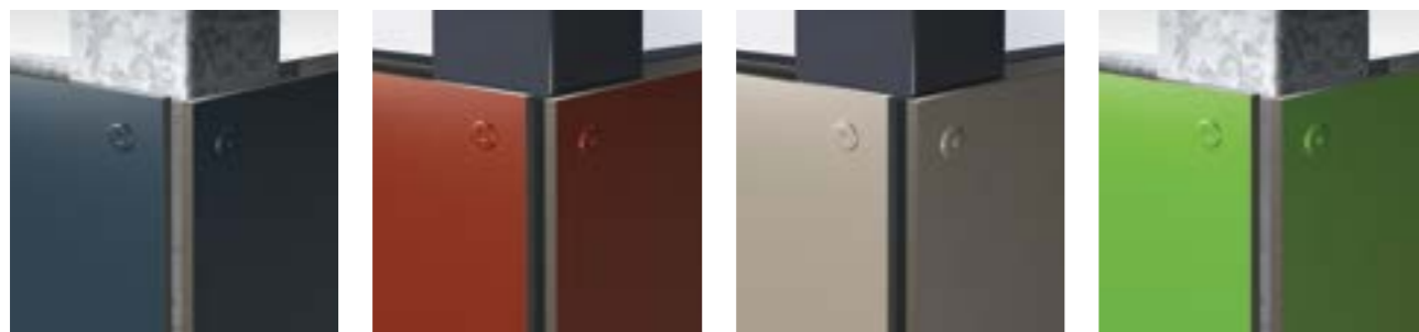
HPL Rohové ukončenie

HPL (High Pressure Laminate – vysokotlakový laminát) je prírodný produkt, pre použitie v interiéri a exteriéri, má vysokokvalitný zhustený, uzatvorený a skúškami v exteriéri osvedčený povrch, ktorý je chránený melamínovou živicom. Farebné odtiene sú v ponuke vo viacerých vzorkovníkoch. Platne hrúbky 6 mm sú slepými nitmi v rovnakom farebnom odtieni bezpečne a natrvalo prinitované na oceľovú konštrukciu. Esteticky náročné prestrešenie s vysokou kvalitou a dlhou životnosťou.