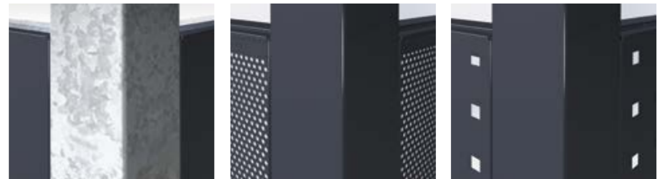
Plný plech, žiarovo zinkovaný