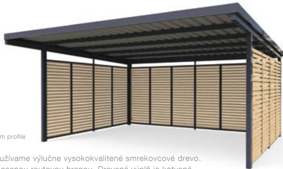
Drevená výplň v komorovom profile

Pre drevenú výplň používame výlučne vysokokvalitné smrekovcové drevo. Drevené laty sú so skosenou rautovou hranou. Drevená výplň je kotvená pomocou komorového profilu medzi základnú oceľovú konštrukciu.