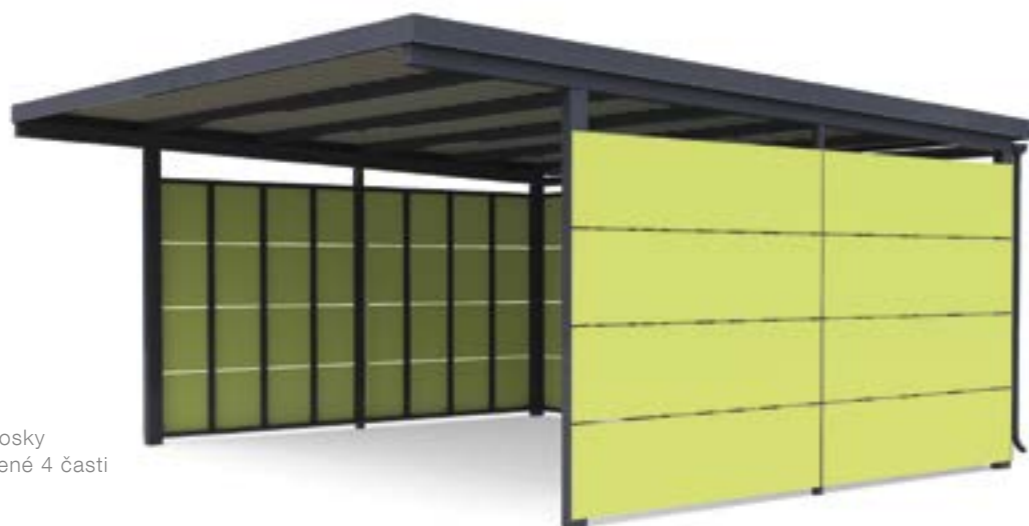
HPL dosky rozdelené 4 časti