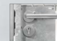
Deurklink roestvrij staal