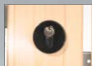
Slot met profielcilinder