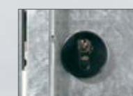
Slot met profielcilinder