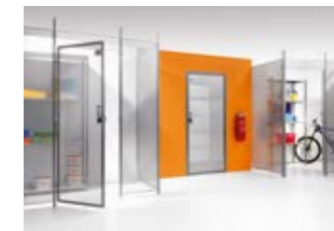
Scheidingswandsysteem met geperforeerde platen