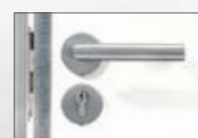
Deurklink roestvrij staal