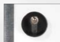
Slot met profielcilinder