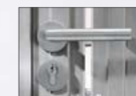
Deurklink roestvrij staal