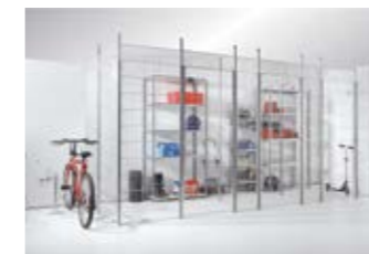
Scheidingswandsysteem met gaspanelen