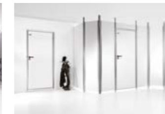
Scheidingswandsysteem met spaanplaten