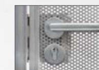
Deurklink roestvrij staal