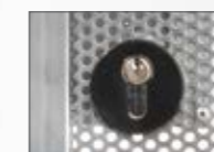
Slot met profielcilinder