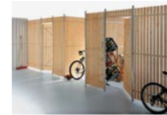
Scheidingswandsysteem met houten profielen