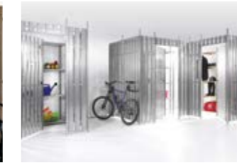
Scheidingswandsysteem met stalen lamellen