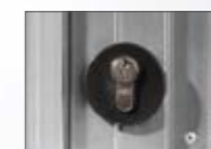
Slot met profielcilinder